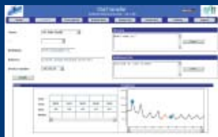
Bloedglucose profiel weergave

Modus voor meerdere patiënten (speciaal voor artsen en diabetesverpleegkundigen).